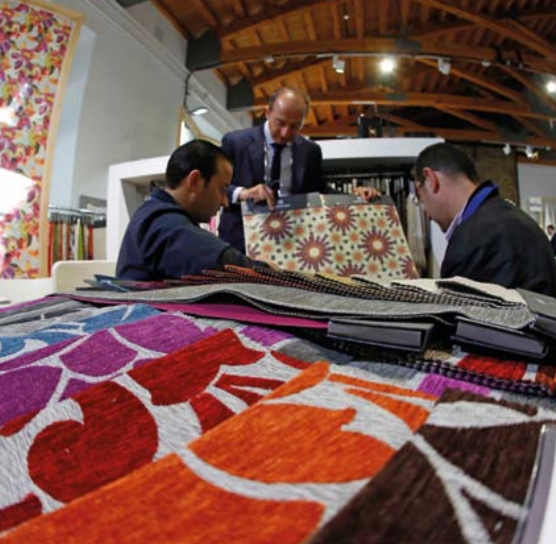
Projeto co-financiado pelo Programa Interreg Sudoe através do Fundo Europeu de Desenvolvimento Regional (FEDER)